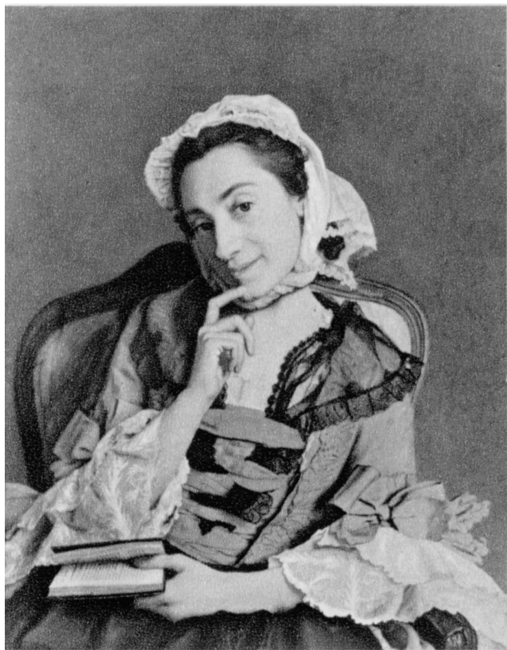
Madame d'Épinay. Pastel de Liotard, vers 1759.

In große Verlegenheit setzte mich dabei die Scham, so laut und geradezu mich selbst Lügen zu strafen. Konnte man nach den strengen Grundsätzen, die ich so eifrig aufgestellt hatte, nach den starren Maximen, die ich gepredigt, mit so viel beißenden Ausfällen gegen die weibischen Bücher, die Liebe und Weichlichkeit atmeten, etwas Unerwarteteres, Ärgerlicheres sich denken, als mich mit eigener Hand unter die Verfasser solcher Bücher, die ich so hart getadelt, mich einschreiben zu sehen? Ich fühlte diesen Widerspruch in seiner ganzen Stärke, ich warf ihn mir vor, ich errötete darüber, grämte mich: aber das alles brachte mich nicht zur Vernunft zurück. Vollständig unterjocht musste ich es auf alles ankommen lassen und mich entschließen, dem, was man darüber sagen würde, zu trotzen; später konnte ich ja darüber beschließen, ob ich mein Werk zeigen wollte oder nicht. Denn ich setzte noch nicht voraus, dass ich je dazu kommen werde, es zu veröffentlichen. [...]