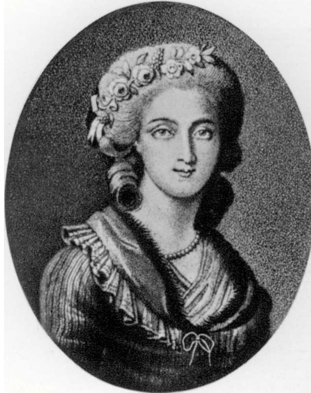
La comtesse d'Houdetot, d'après un portrait gravé par Corot.

alles, seinen Ruhm, sein Ansehen, sein bescheidenes Auskommen als Schriftsteller, seine Freundschaften, sein Leben, rein alles zerstört. Nur noch einige konservative Adelige unterstützen ihn nach seiner Flucht aus England zurück nach Frankreich mit dem Notwendigsten, weil er als unversöhnlicher Feind Voltaires ihnen eventuell noch ein klein wenig nützlich sein könnte.